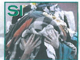
Roba de vestir, calçat, roba de llit, draps, etc. (en bosses ben tancades)