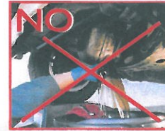
Olis minerals de cotxes i màquines, olis i greixos animals