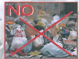
Plàstics, envasos, paper/cartró, vidres, restes orgàniques.